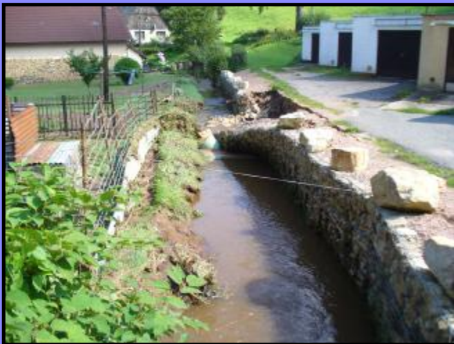
Opěrná zeď u potoka po povodních v roce 2007