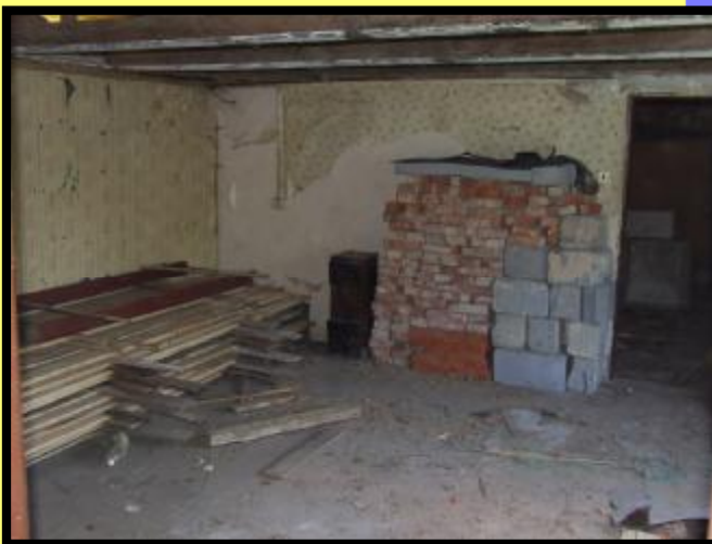
Klubovna SDH Libňatov před přestavbou