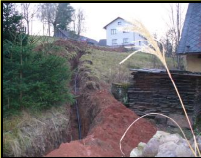
Prodloužení vodovodního řadu v dolní části obce