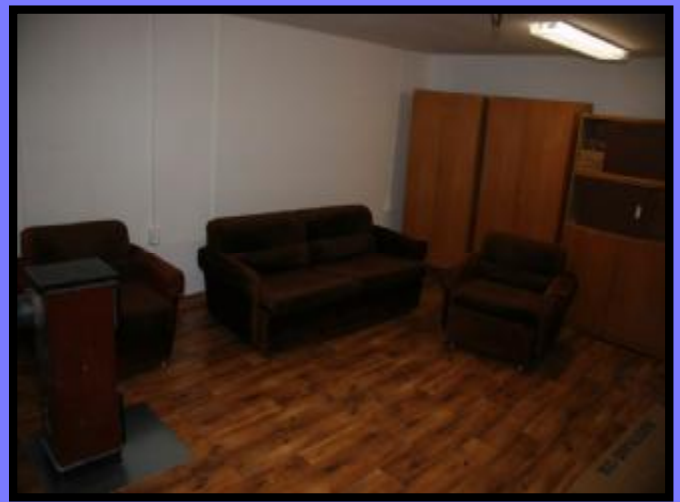
Klubovna SDH Libňatov po přestavbě