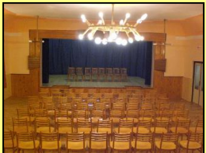
Sál kulturního domu po přestavbě