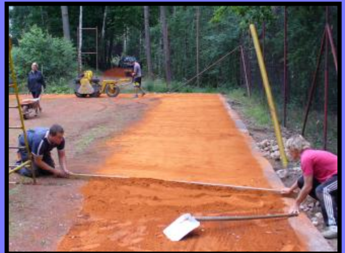
Pokládání antuky na tenisovém kurtu