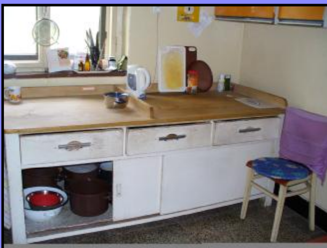
Kuchyň mateřské školy před rekonstrukcí