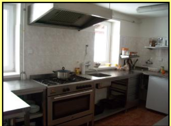
Kuchyň mateřské školy po rekonstrukci